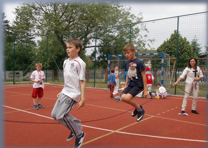
Ciekawe zajęcia sportowe