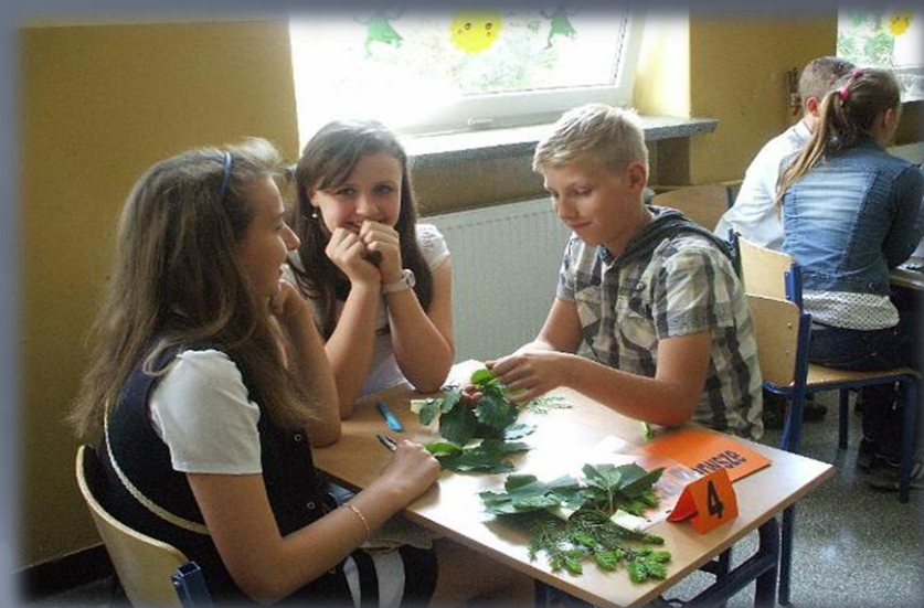
Organizujemy Gminne Konkursy Ekologiczne