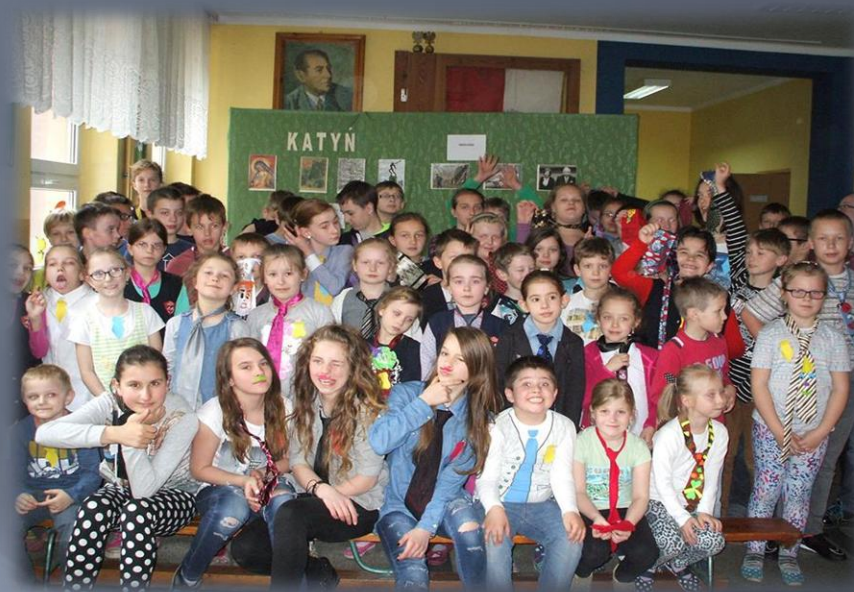
Dzień śmiesznego krawata