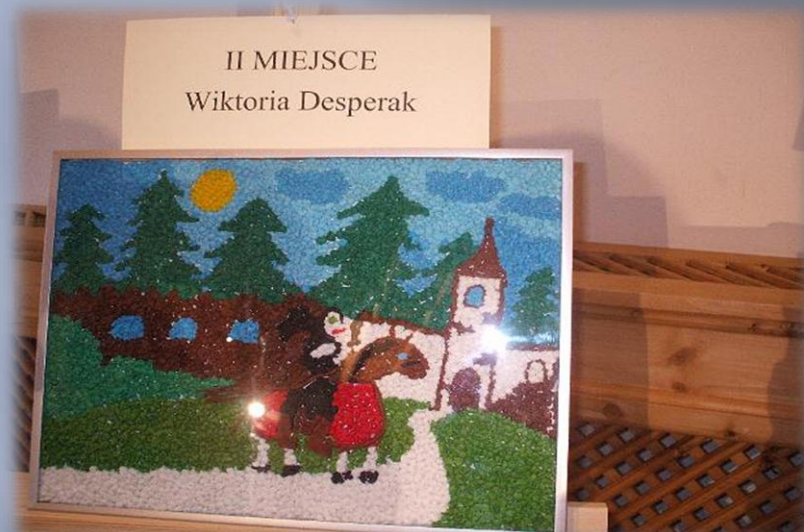
Konkurs "Mali Rycerze na Szlaku Orlich Gniazd"