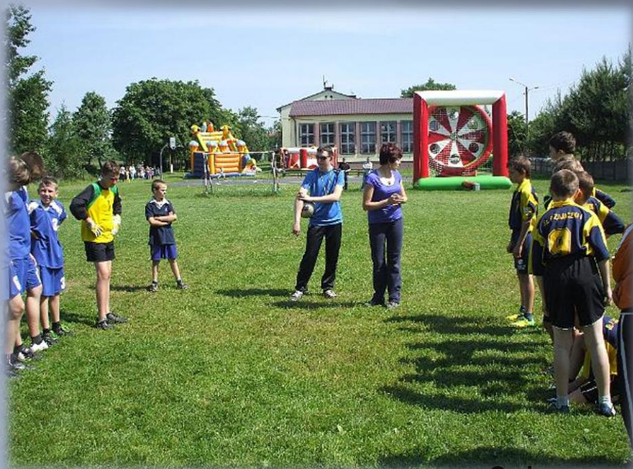
Gminne zawody sportowe