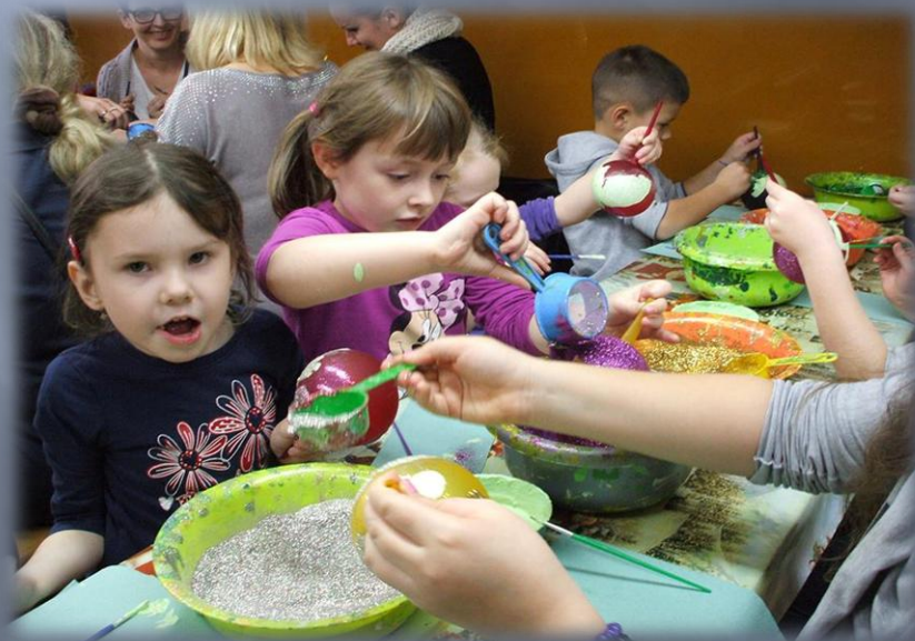
Wycieczka do fabryki ozdób choinkowych