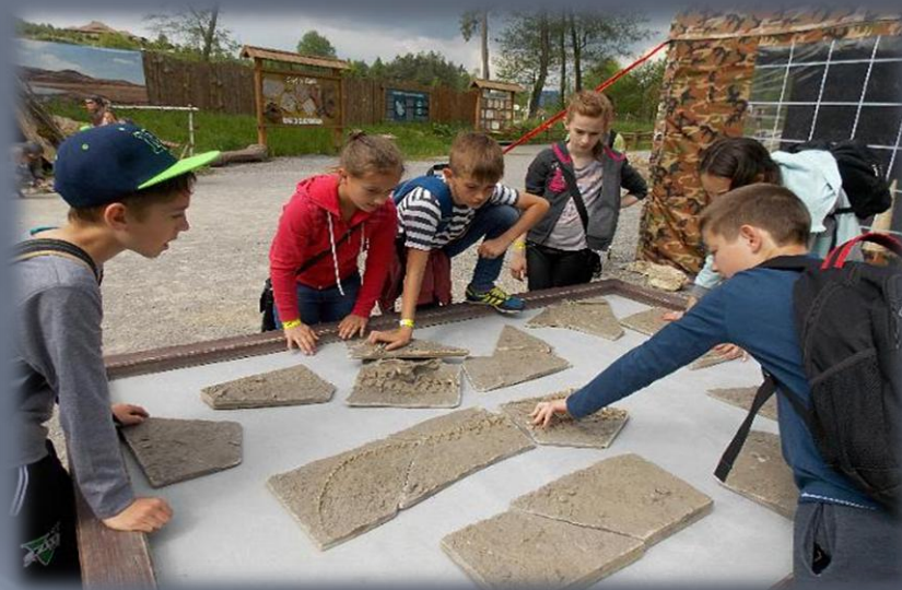
Wycieczka w Góry Świętokrzyskie.