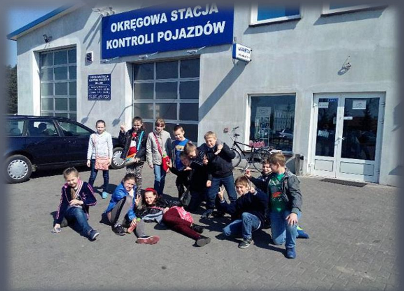
Wycieczki do zakładów pracy.