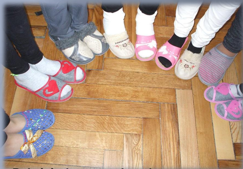
Dzień śmiesznego kapcia