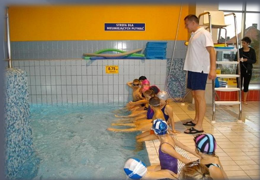
Wyjazdy na basen.