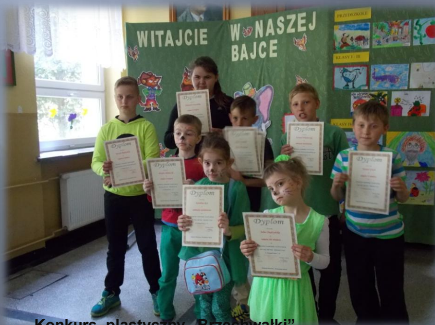
Konkurs plastyczny „Brzechwaki”