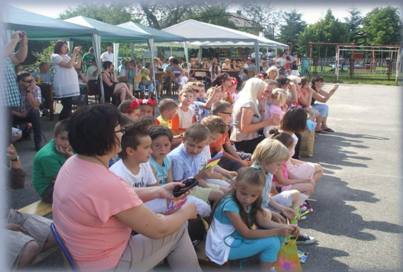
Festyn „mama, tata i ja”