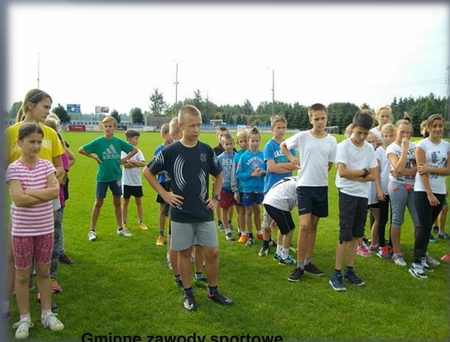
Gminne zawody sportowe