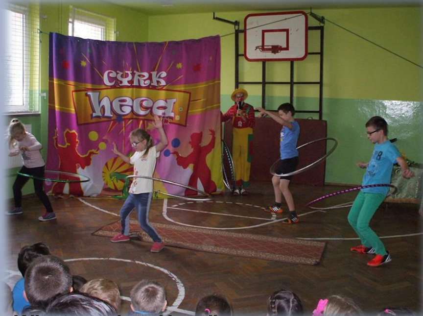
Wizyta cyrku „Heca”