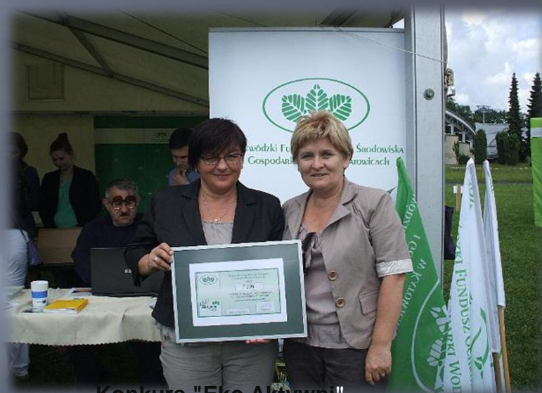
Konkurs "Eko Aktywni"