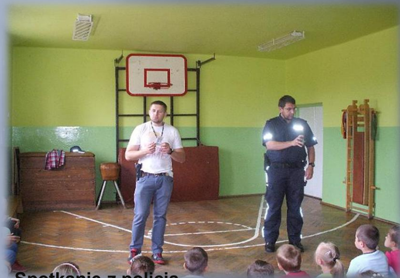
Spotkanie z policją