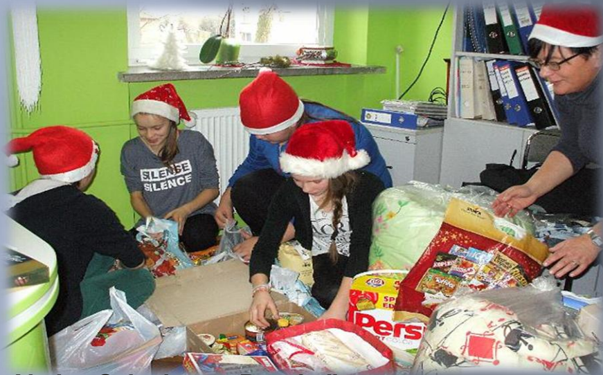
Akcja „Szlachetna Paczka”