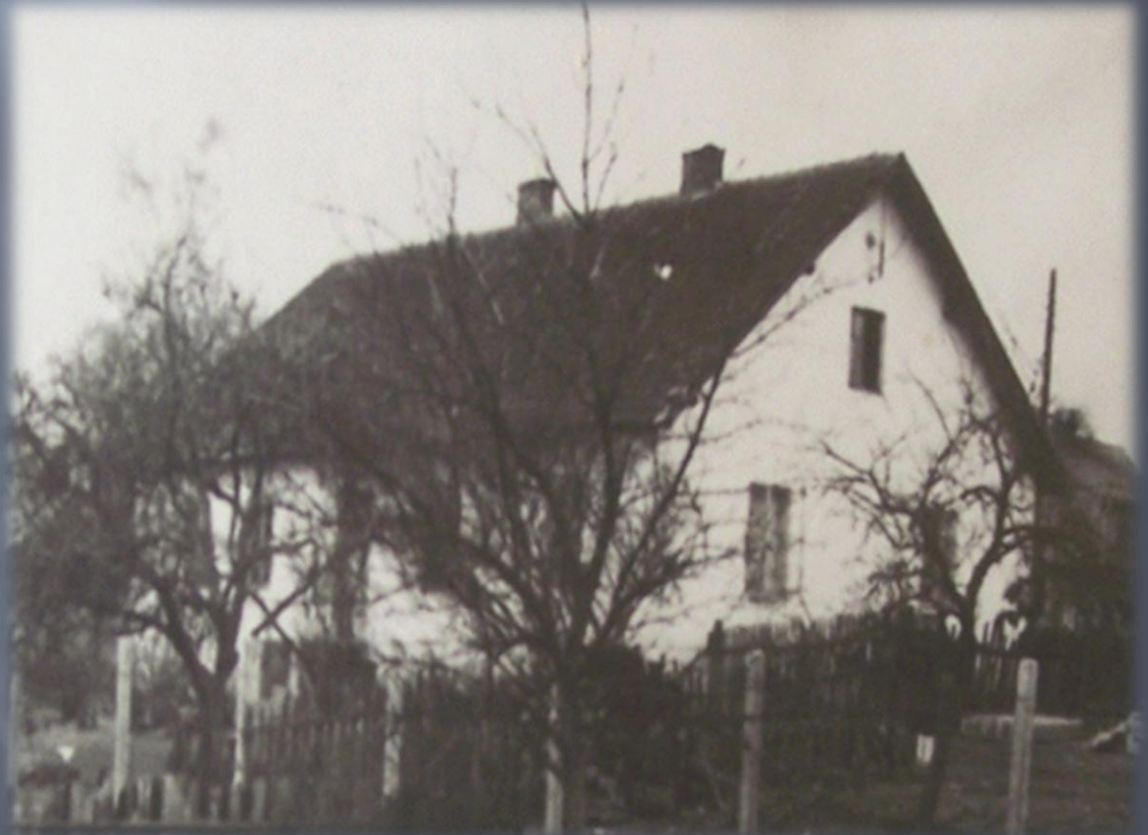
Budynek starej szkoły

W latach 1910-1925 została wybudowana w Zajączkach Pierwszych Szkoła Ludowa Gminna