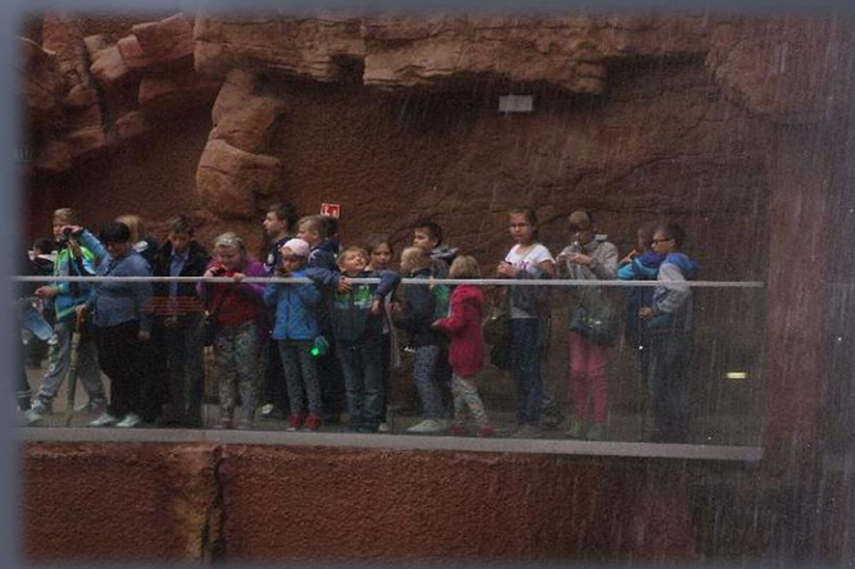
Wycieczka do Wrocławia