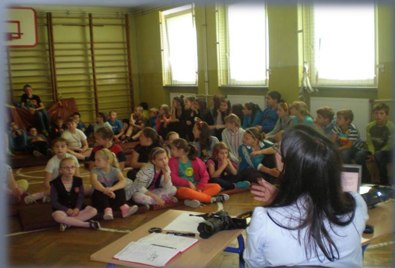
Spotkanie z fotografem