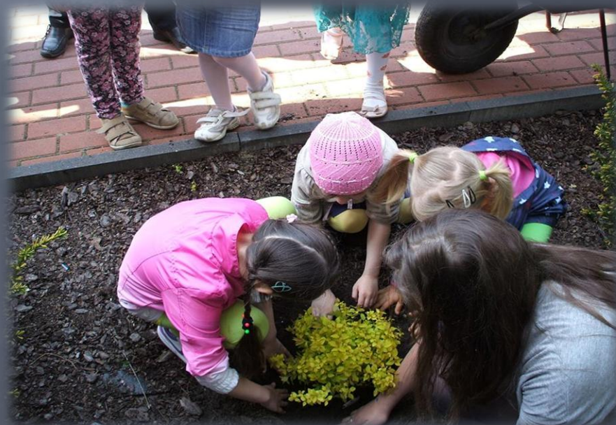
Sadzenie drzew i krzewów