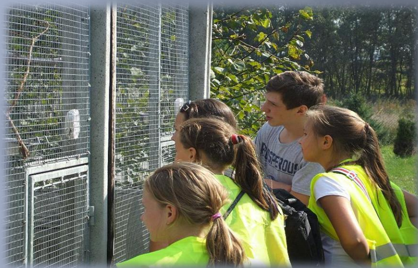
Wycieczka do hodowców papug.