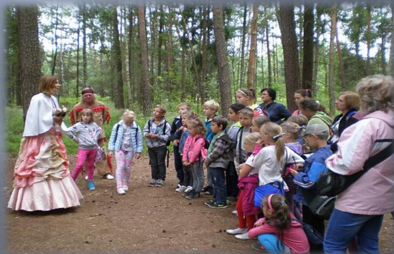
Wycieczka do „Zaczarowanego lasu”