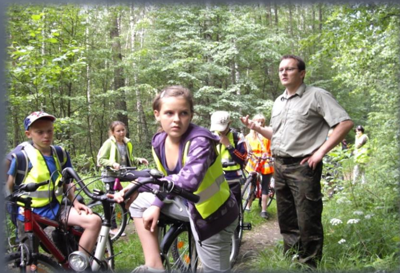
Spotkanie z leśnikiem