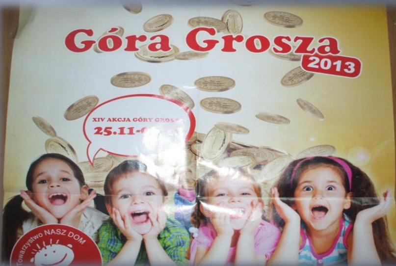
Akcja „Góra grosza”