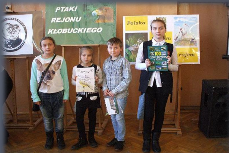
Powiatowy Konkurs Ornitologiczny