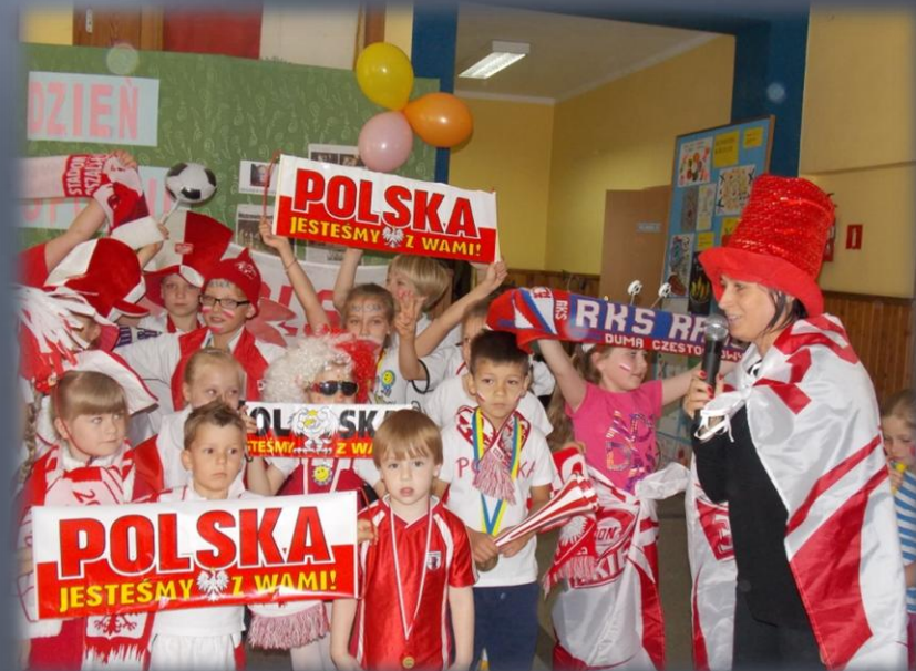
Festyn – Dzień Dziecka i Sportu