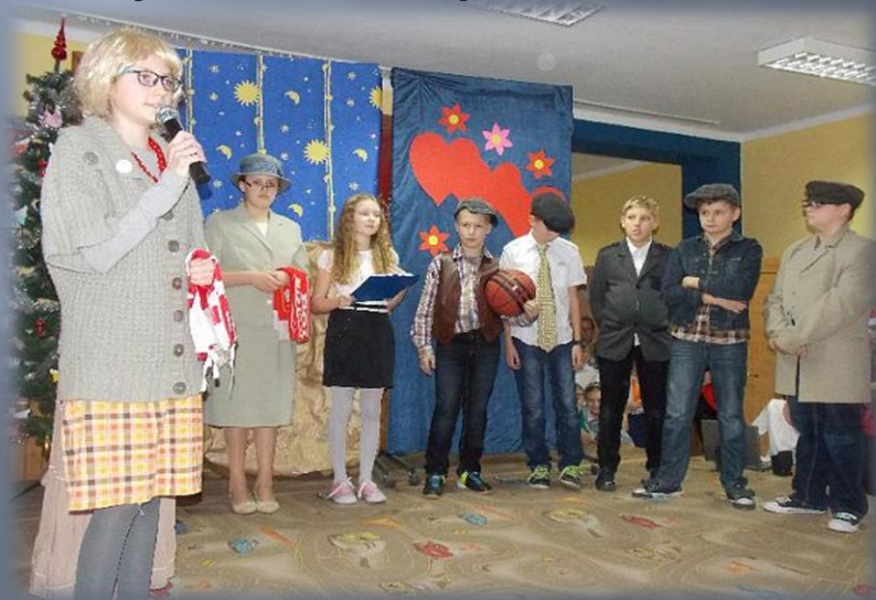
Dzień Babci i Dziadka