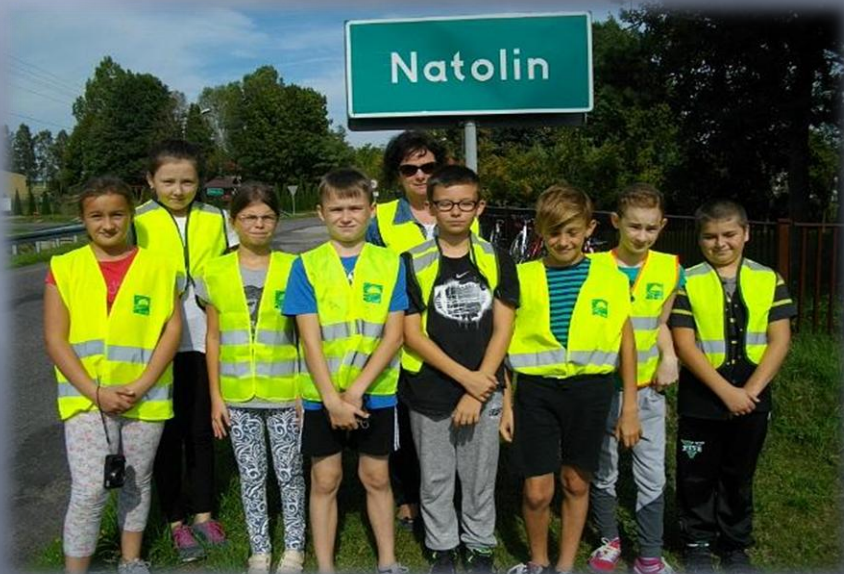
Wycieczki rowerowe po okolicy.