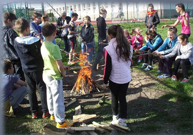
Obchodzimy Dzień Ziemi