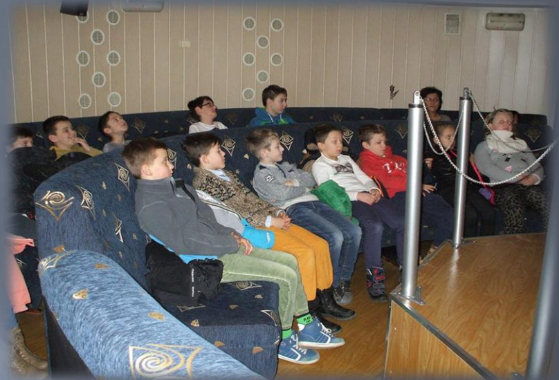
Wycieczka do Planetarium i lodowisko