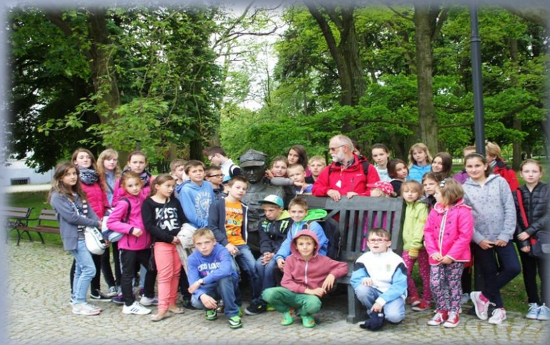
Wyjazd edukacyjny "Szlakiem Piastowskim"