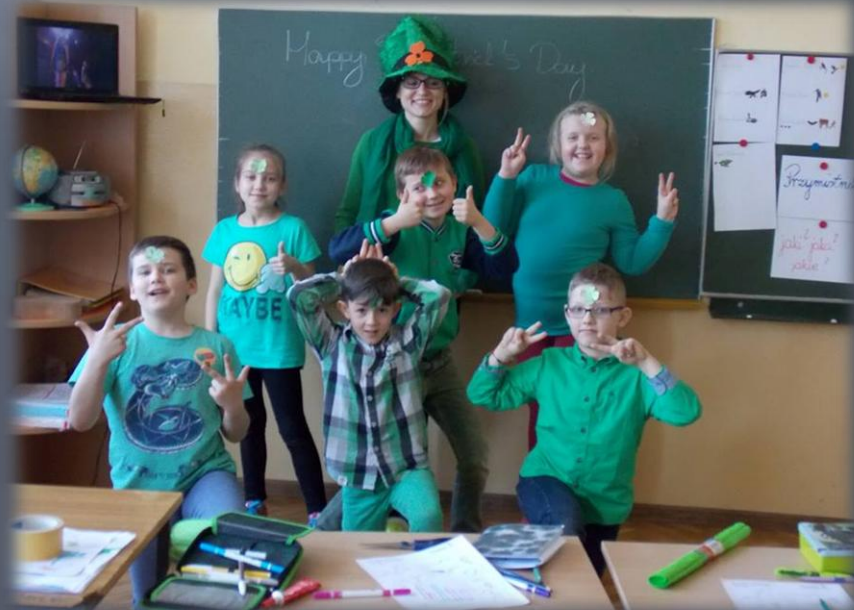
Dzień św. Patryka