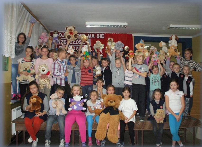
Dzień pluszowego misia