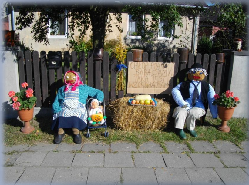
Dożynki Powiatowo - Gminne